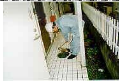
・雨樋誤接続、その他の雨水流入原因を目視等で確認