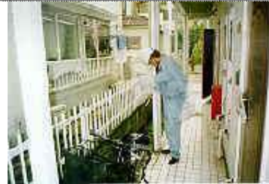
・調査内容、配管系統図を現場表に記入する