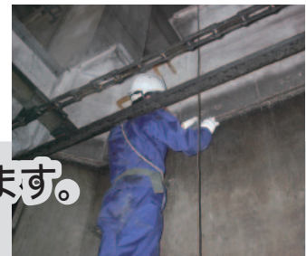
コンクリート構造物劣化調査