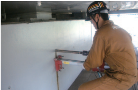
ソフトコアリング