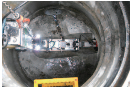
衝撃弾性波ロボット

マネジメントの、寿命管理やリスク管理が必要とする、定量的な劣化診断技術。 ペンタフは、この新しい劣化診断に必要な、現場調査を提案します。