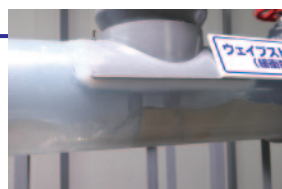
ウェーブストレーナ