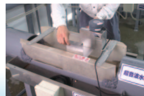
オフセットチェッカー